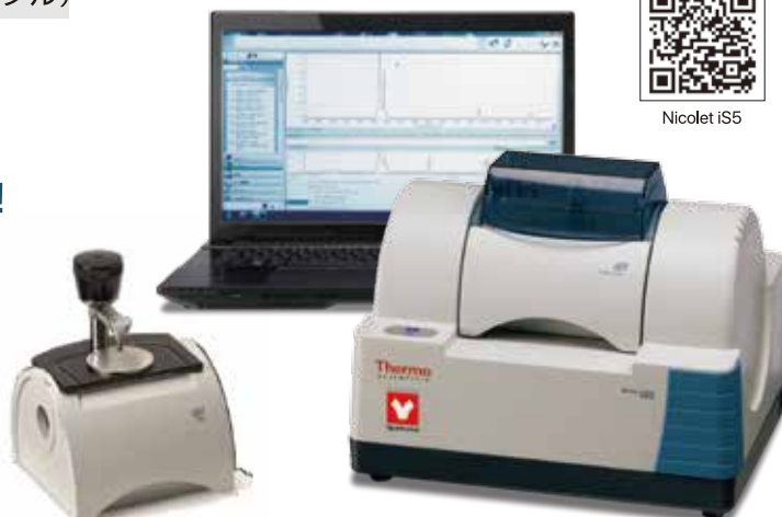
iD7 1回反射型ATRをセットにした今だけの特別価格