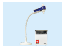
⑮ 純水デリバリーユニット