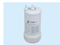
② 前処理カートリッジ