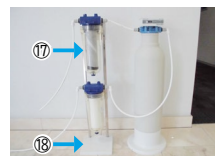
⑰⑱ フィルタハウジング/スタンド