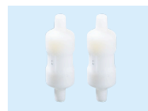
① メンブレンフィルタ