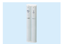
③ イオン交換樹脂カートリッジ